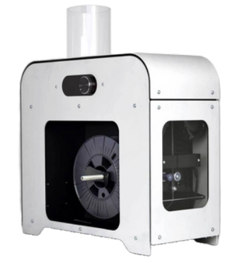
Filament Maker ONE - Composer