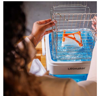
PVA Removal Station 加快近四倍時間移除水溶性 PVA 支撐材。