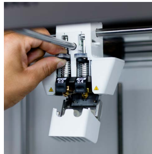
列印噴頭 CC 強化的鋼噴嘴，用於印製玻璃纖維和碳纖維複合材料。提供0.4mm和0.6規格。