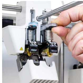
列印噴頭 BB 可選0.4、0.8mm噴頭口徑，專用於水溶性支撐PVA線材。